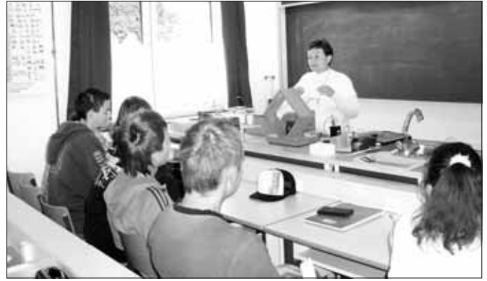
Fizika óra a 11. A osztályban

Újabb szaktanteremmel bővült az enyingi Bocsor István Gimnázium a 2007/2008-as tanévben. A meglévő informatikai és az elmúlt évben átadott idegen nyelvi labor mellé a fizikai-kémiai kísérletek bemutatására alkalmas természettudományos szaktantermet, előadót vehették birtokba a gimnáziumi tanulók. Az új tanterem kialakítására szükséges költségeket részben pályázat útján nyerték, részben önerőből biztosították. A korszerű, modern, tanári laborasztal mellé a kísérletek elvégzéséhez előírt tanulóasztalok kerültek. A kivitelezési munkálatokat Enying Város Szolgáltató Intézménye végezte.