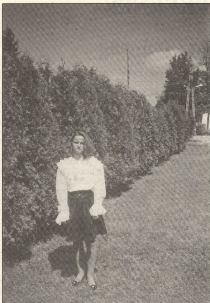
És a két épületet összekötő tujasor, amely előtt szívesen fényképezkednek a búcsúzó 8. osztályosok