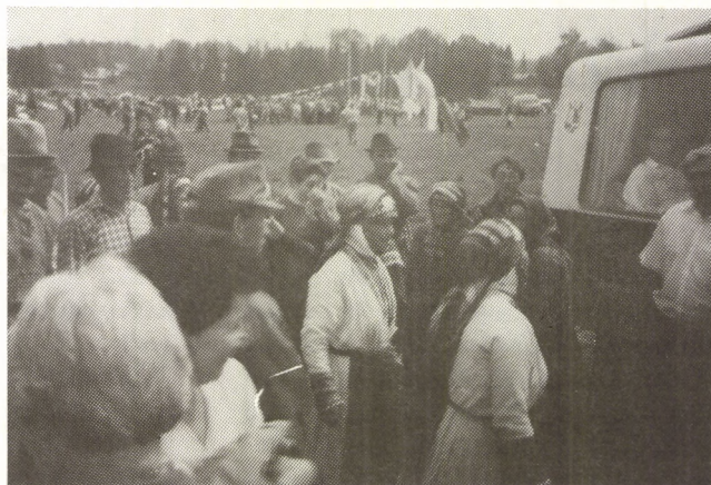
Látogatás a böszörményeknél

köszönt el tőlünk, mintegy keretbe foglalva élményeink színes csokrát.