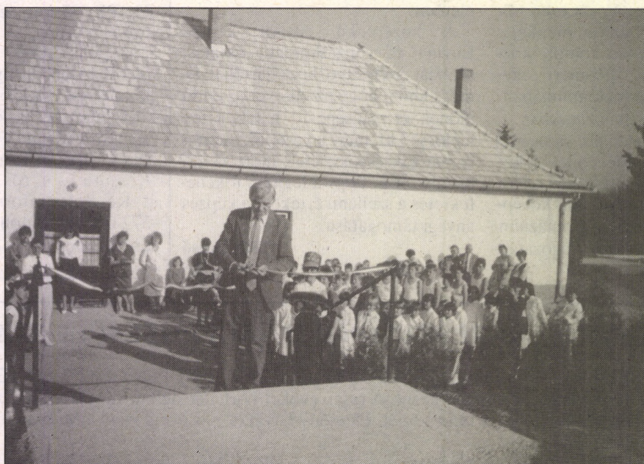
Az alsó tagozatosok iskolája a sportpálya avatásakor