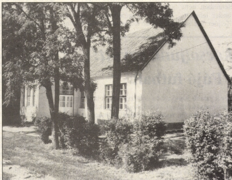
A felső iskola épülete