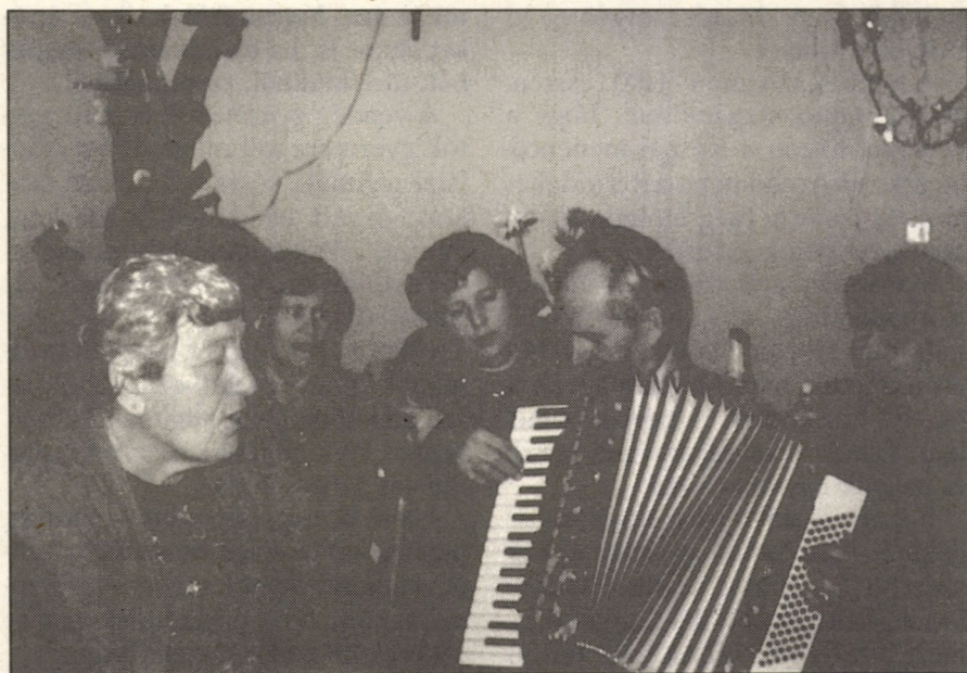
Pótszilveszter a balatonbozsoki klubban. Vendégek a dégi nyugdíjasklub tagjai