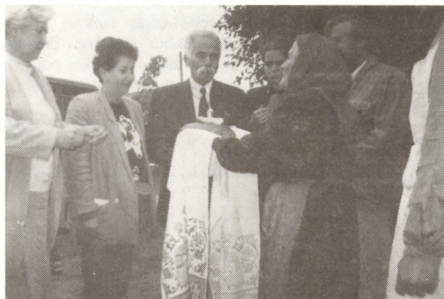
Udmurt vendégfogadás sóval és kenyérral

Városunk lakói már három alkalommal gyönyörködhetek az Ajkaj együttes színpompás műsorában. Az enyingi televízió jóvoltából részesei lehettünk az Orosz Kulturális Központ és a Magyar Udmurt Baráti Társaság által Budapesten rendezett kiállításnak, amelyen Valentyin Bjelih festőművész mutatta be képeit. Hiszem, hogy ezek mindnyájunknak feledhetetlen élményt